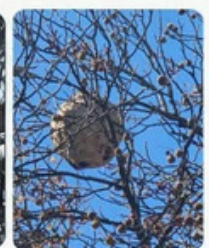
Ex. 5 : nid en forme de poire (grenier)