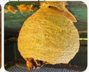
Ex. 2 : petit nid accroché