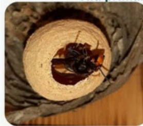
Ex. 1 : petit nid sous abri