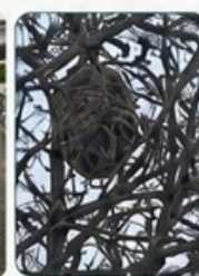
Ex. 4 : nid sphérique dans la ramure