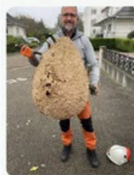
Ex. 3 : nid haut dans un arbre